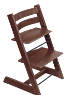
Stokke tripp trapp