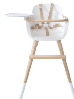
Micuna Ovo Luxe One