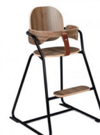
Charlie Crane Tibu